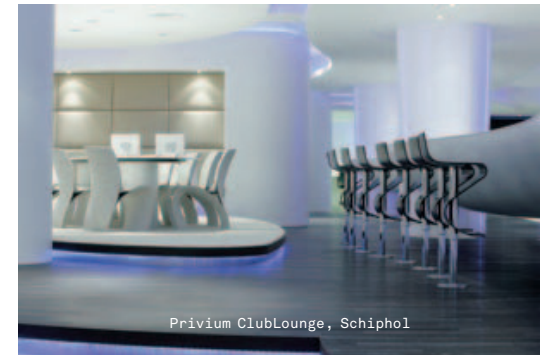
Privium ClubLounge, Schiphol