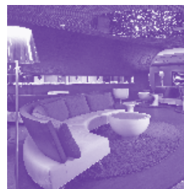
Miele Inspirience Centre, Vianen